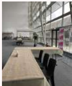
(photo prise personnellement)

Dans l'ensemble, mon stage m'a permis de participer à diverses activités (graphisme, rédaction, commerce, publicité, participation à la réalisation d'émissions radio, production de contenus audiovisuels, gestion de contenu sur les plateformes web et participation à des projets de communication externe), ce qui a été une expérience précieuse et enrichissante dans divers aspects du journalisme, de la communication et de la gestion des médias sociaux dans le contexte dynamique d'une station de radio.